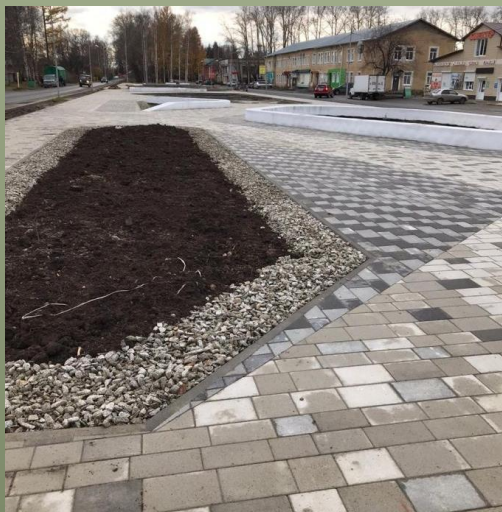
Устройство щебеночного покрытия