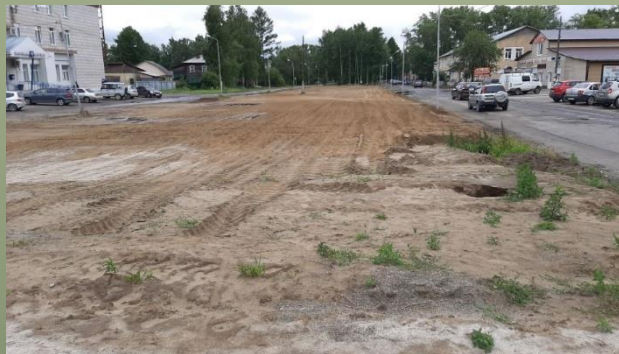
Подготовительные работы: планировка площадей, валка деревьев, корчевка пней