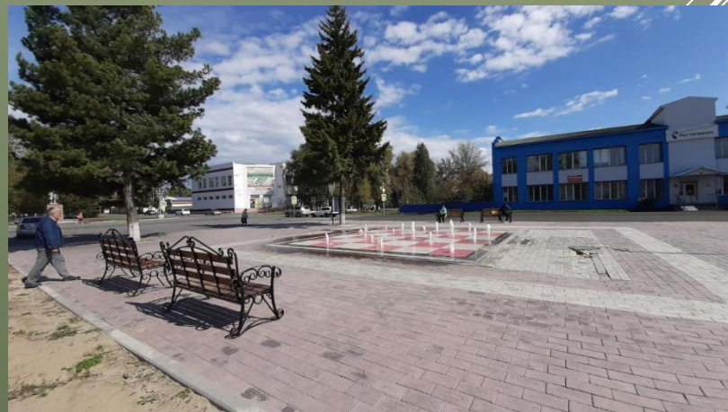
Установка лавочек и урн