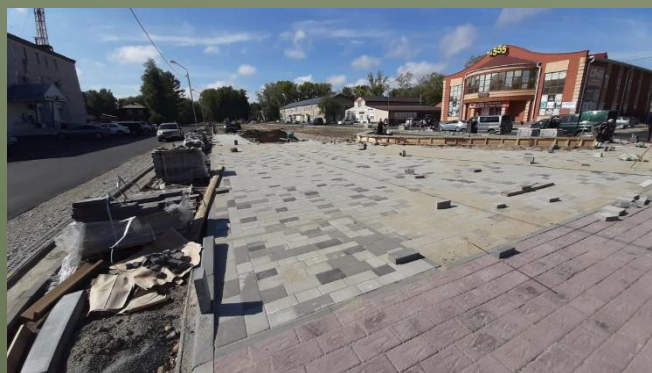
Устройство покрытия из тротуарной плитки