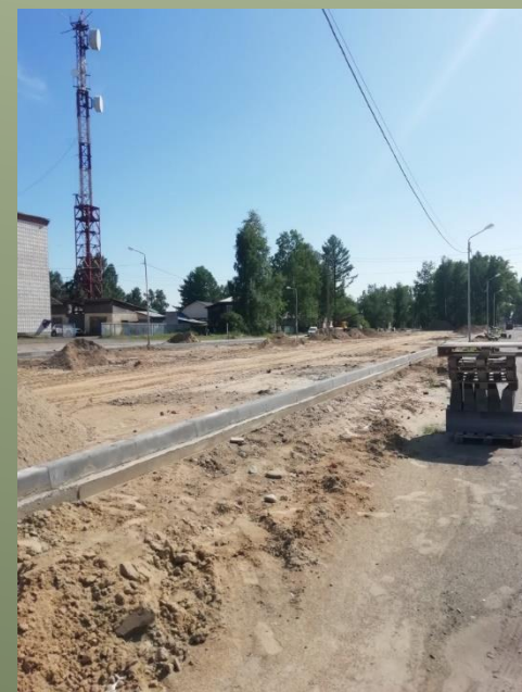
Установка бортовых камней