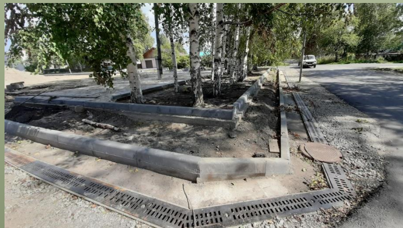
Устройство водоотводного лотка